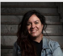
Femmes hiboux